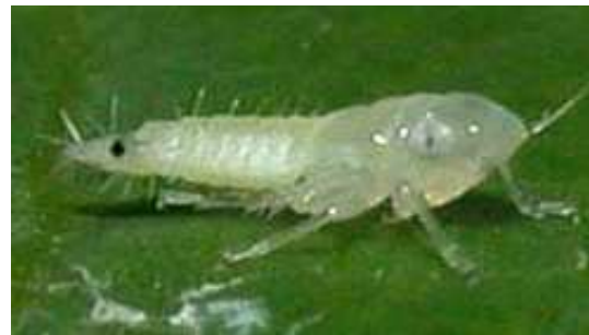
L2 – larve stade 2 (2,5 mm)