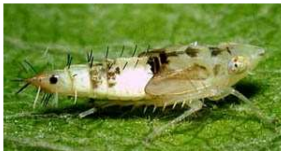
L5 – larve stade 5 (5 mm)