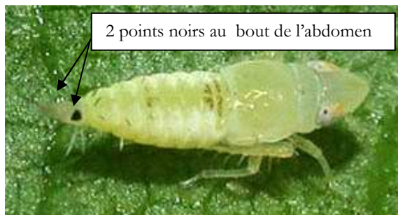
L3 – larve stade 3 (3,5 mm)