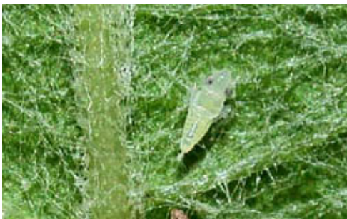
L1 – larve stade 1 (1,5 mm)