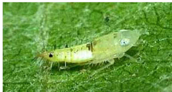
L4 – larve stade 4 (4,5 mm)