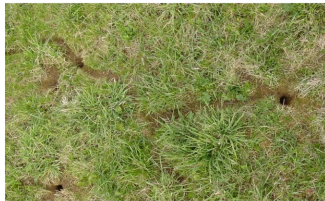
Campagnol des champs