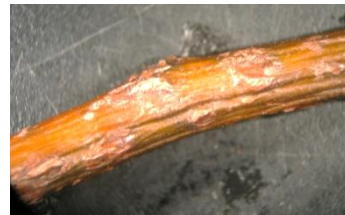
Photos : Taches de tavelure sur fruits (Williams) et chancre sur rameaux