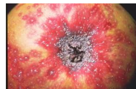
Pou de San José sur fruits (Source : INRA)

Estimation du risque : Repérer les parcelles atteintes.