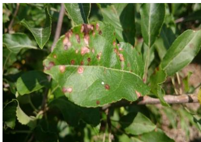
Black rot sur feuilles

Estimation du risque : En vergers à risque, les orages peuvent provoquer des projections. Surveiller les fruits situés au bas des arbres.