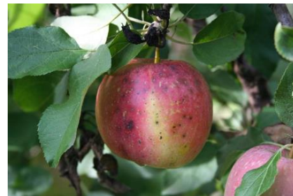
Black rot sur fruits