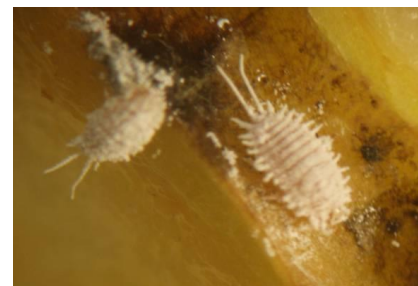
Pseudococcus sur fruits

La présence de larves sur fruits peut conduire à des dégradations de la qualité en conservation.