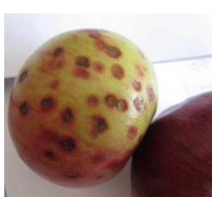
Black rot sur fruits