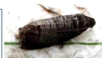
Papillon Cydia pomonella sur plaque englué piège Delta longueur : 15 à 22 mm