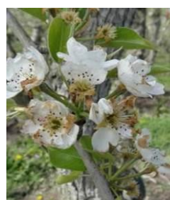
Stade G BBCH67