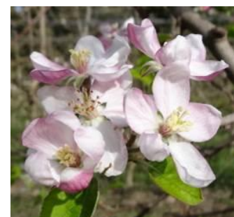
Stade F2 BBCH65

Granny stades phénologiques