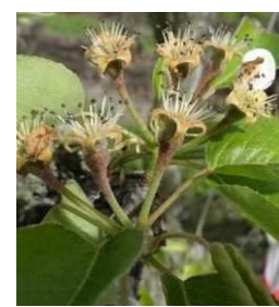
Stade H BBCH69

Guyot stades phénologiques