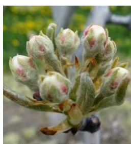
Stade E2 BBCH59