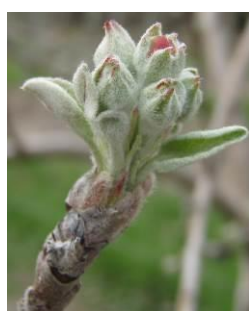
Stade E BBCH57