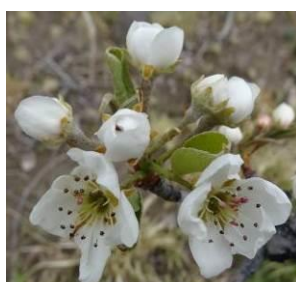
Stade F2 BBCH65