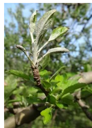
Foyer primaire d'Oïdium

Mesure prophylactique : Supprimer les rameaux oïdiés qui constituent l'inoculum de départ (voir photo ci-contre).