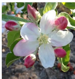
Stade F BBCH60