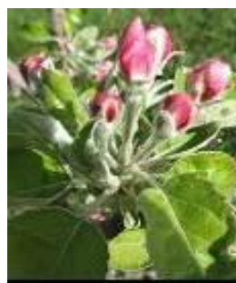
Stade E2 BBCH59