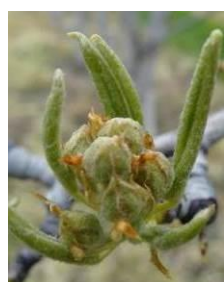
Stade D3 BBCH56