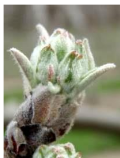
Stade D3 BBCH56