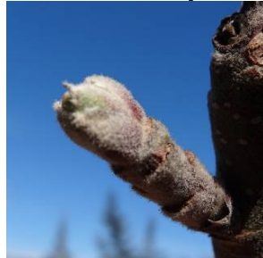
Stade B (pointe verte)