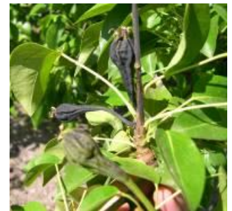
Photo (source La Pugère) : Feu bactérien sur bouquet de fruits (poirier)

Estimation du risque : Des contaminations sont possibles lors d'épisodes pluvieux, et en particulier orageux.