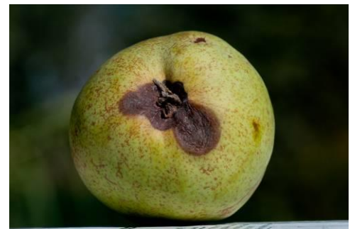
Tache nécrosée à l'œil

Ce Bulletin est produit à partir d'observations ponctuelles réalisées sur un réseau de parcelles. S'il donne une tendance de la situation sanitaire, celle-ci ne peut pas être transposée telle quelle à chacune des parcelles. La Chambre régionale d'Agriculture et l'ensemble des partenaires du BSV dégagent toute responsabilité quant aux décisions prises pour la protection des cultures. La protection des cultures se décide sur la base des observations que chacun réalise sur ses parcelles et s'appuie, le cas échéant, sur les préconisations issues de bulletins techniques.