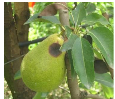
Stemphyliose sur fruits

Estimation du risque : la période à risque s'étend de la floraison jusqu'à la récolte. La période de risque important sur fruits débute à partir de mi-mai. Les conditions chaudes et humides (rosées, irrigation) sont très favorables au développement du champignon.