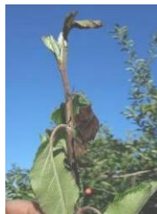
Adulte Zeuzera pyrina et pousse minée par la zeuzère