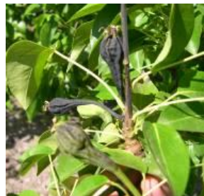
Feu bactérien sur bouquet de fruits (poirier)

Estimation du risque : Des contaminations sont possibles lors d'épisodes pluvieux, et en particulier orageux.