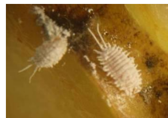
Pseudococcus sur fruits (La Pugère)